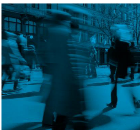
Orts- und Regionalplanung