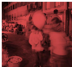
Städtebau und Architektur