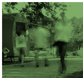
Landschaft und Freiraum