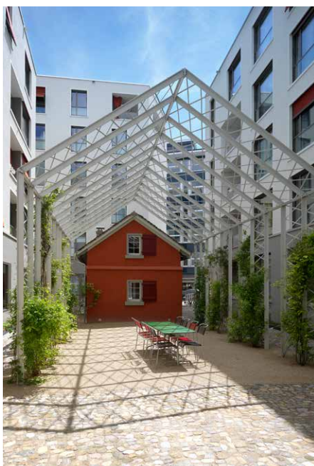
Cortile con giardino a Zurigo Raderschallpartner AG, Meilen

In qualità di persona responsabile della direzione generale delle attività di pianificazione o di persona esperta qualificata operante in team interdisciplinari, l'architetto/a paesaggista riveste un ruolo centrale nella concezione dei compiti di pianificazione e nell'elaborazione e formulazione di un approccio risolutivo. L'architetto/a paesaggista guida o assiste gli specialisti coinvolti nel progetto di pianificazione, funge da contatto con il/la committente e promuove uno sviluppo del paesaggio integrale e di qualità che tenga conto anche dello sviluppo urbano.