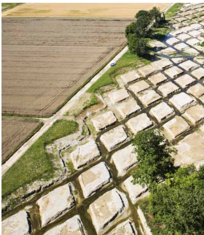
Rivitalizzazione dell'Aire, Ginevra Atelier Descombes Rampini SA, Ginevra

La partecipazione a procedure di assegnazione qualificate (concorsi di idee e di progetti oppure incarichi di studio) offre all'architetto/a paesaggista la possibilità di misurarsi con colleghe e colleghi in modo trasparente, avviare una discussione professionale e rafforzare in questo modo le proprie competenze.