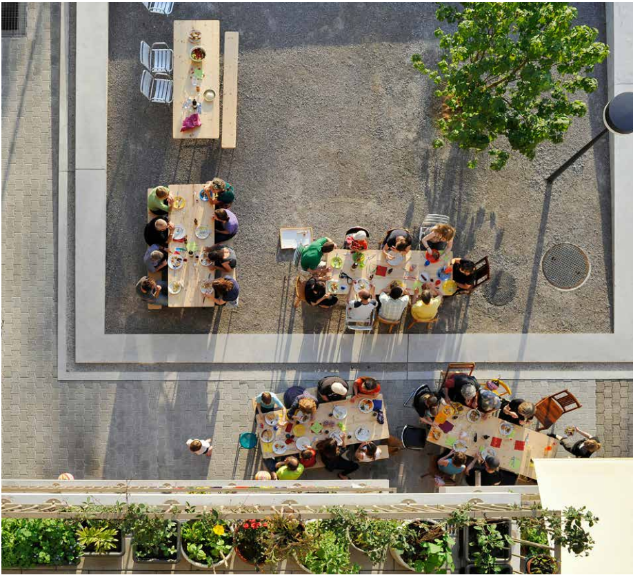
KraftWerk2, coopérative d'habitation à Zurich Schmid Landschaftsarchitekten GmbH, Zurich