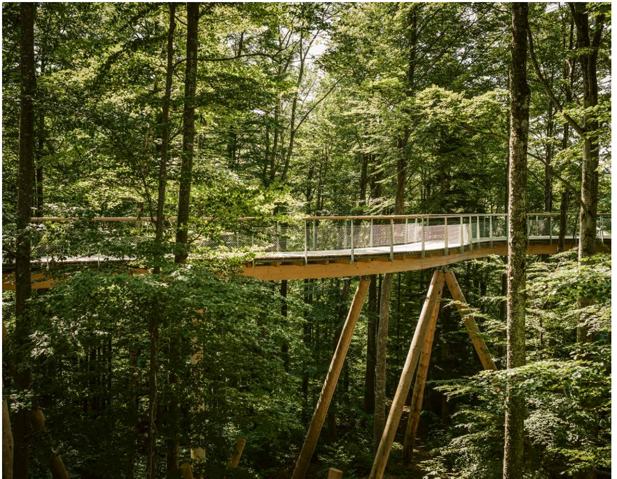
Sentier de la canopée du Neckertal, Mogelsberg, SG Kollektiv Nordost GmbH, Saint-Gall