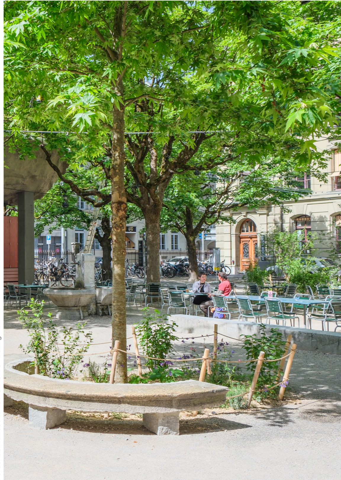
links Rundbank aus Beton vor Pflanzinsel