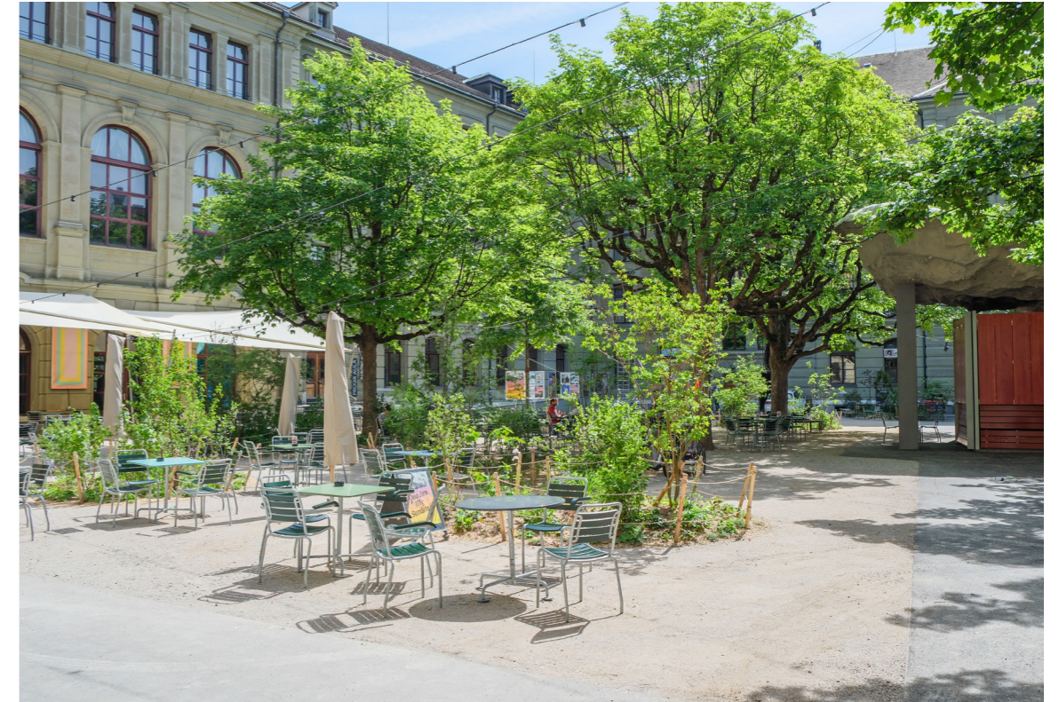
rechts Aussengastronomie Turnhalle und Pavillion im Hintergrund

Der Progr-Hof ist ein eigenständiger Teilraum im öffentlichen Raum. Er ist sowohl öffentlicher Raum wie auch Hof, Teil der Stadt und Ort für Kunstschaffende. Diese Doppeldeutigkeit ist eine grosse Qualität des Progrs, sie macht den Reiz dieses speziellen Orts in Bern aus. Gerät sie ausser Balance, kippt die Doppeldeutigkeit in Eindeutigkeit, und die Aura des Progrs verflüchtigt sich.