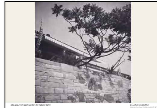
Eisenhorn im Wiegarten der 1950er Jahre

Dr. Johannes Stoffler Landschaftsarchitekten BSLA