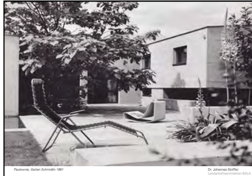
Pully, Gärten Schmidlin 1981