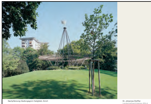
Nachbefassung Stadtgarten Heliopolis, Zürich